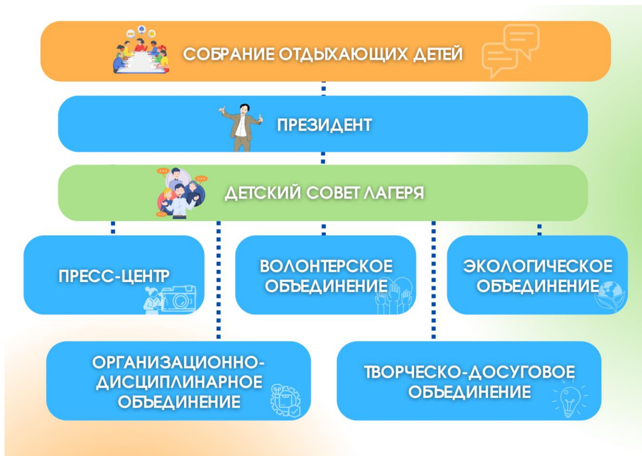
Рис.4. Структура Совета лагеря ДСООЛ «Факел»

В составе Совета лагеря могут быть сформированы комиссии, проектные и инициативные группы по подготовке и проведению конкретного мероприятия, детского проекта.