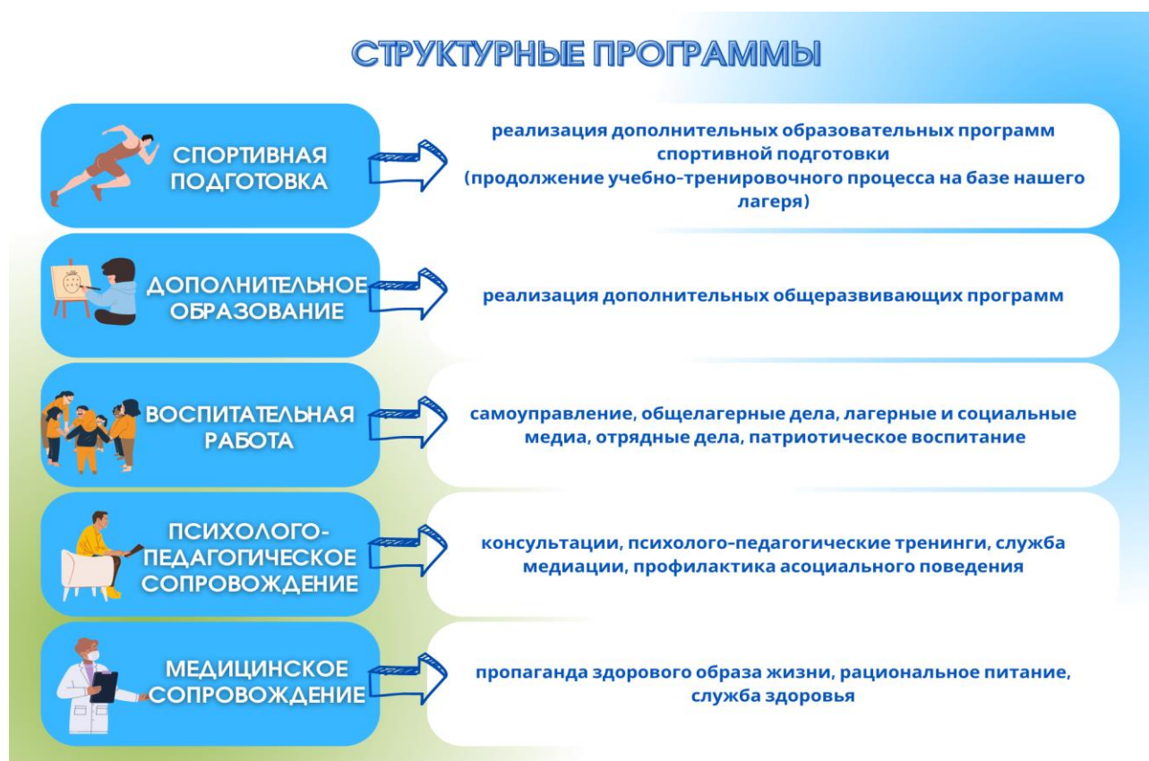
Рис.3. Структурные программы ДСООЛ «Факел»

Образовательное пространство, созданное на территории лагеря направлено на реализацию идеи: “личность есть наивысшая социальная ценность, цель воспитания – стать полноценным субъектом деятельности, познания, самореализации, общения, научиться стремлению быть “первым” в лучшем значении этого феномена. Структура программы состоит из следующих треков: